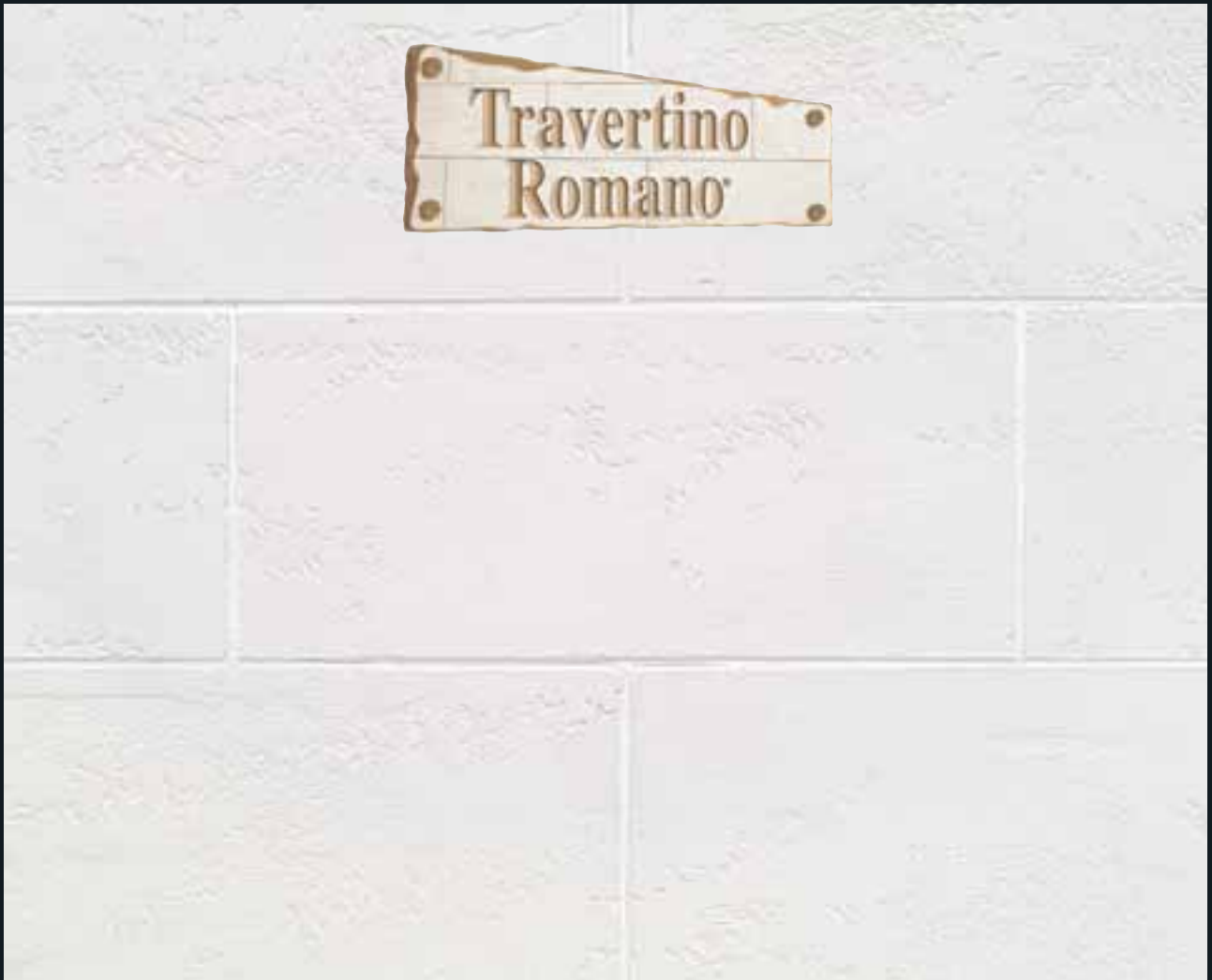
TRAVERTINO ROMANO NATURALE